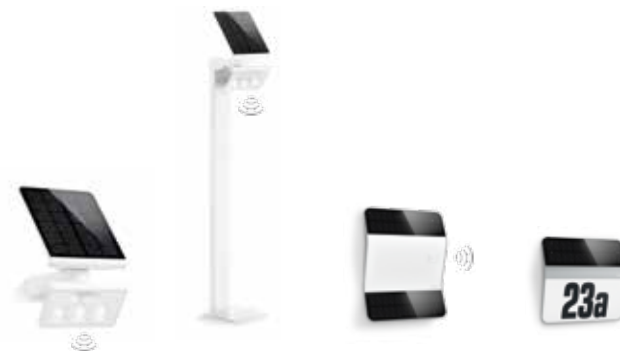
XSolar L-S XSolar GL-S XSolar L2-S XSolar LH-N