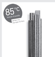
85°C Glitzer Klebesticks 7 mm